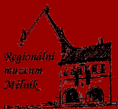
Regionální muzeum Mělník, příspěvková organizace